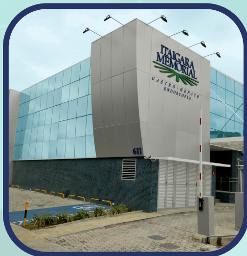
Itaigara Memorial Gastro-Hepato Endoscopia Alameda das Espatódeas, 611 - Caminho das Árvores